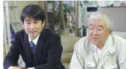
地熱ワールド工業株式会社

A. 以前から興味はありましたが、東日本大震災後に再生可能エネルギーが注目されるようになり、平成24年3月から取組みははじめましたが、その年から実施されたFIT(電気の固定価格買取制度)が追い風となりました。発電する場所の環境や湯量などに合わせて「湯けむり発電」と「バイナリー発電」の2種類の発電方法を提案しています。